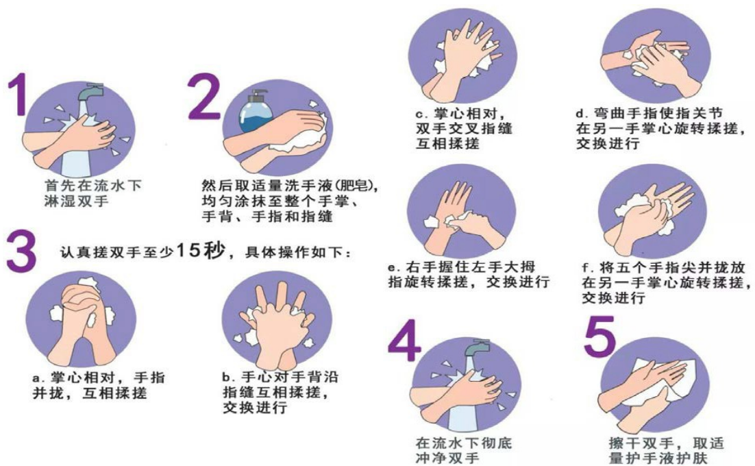
图 6 正确的洗手方法