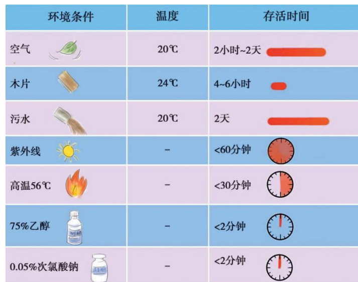
图 2 新型冠状病毒在不同环境中的大致存活时间

病毒表面有四种蛋白，其中刺突蛋白（S 蛋白）使其形如冠状，因而得名，新型冠状病毒在空气、衣物、水体环境中的存活期，新型冠状病毒在人体外的存活与多种因素有关。新型冠状病毒可以在飞沫中存活，但不能单独在空气中长期存在。新型冠状病毒在干燥阴冷环境可存活约 48 小时，环境温度越高病毒存活时间越短，常温空气中约 2 小时毒力即显著减低。