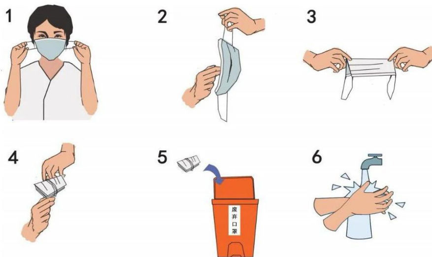
图 5 口罩处置示意图

防疫期间，摘口罩前后做好手卫生。废弃口罩丢弃之前，应折叠成条形后用挂耳绳捆绑成型，将口罩折叠时应将口鼻接触面朝外，有条件的应进行酒精消毒。废弃口罩放入垃圾桶内，每天两次使用 75% 酒精或含氯消毒剂对垃圾桶进行消毒处理。居家隔离者用过的口罩，请在弃置前用水煮沸 10-15 分钟后再投放至“其他垃圾”的收集容器中。