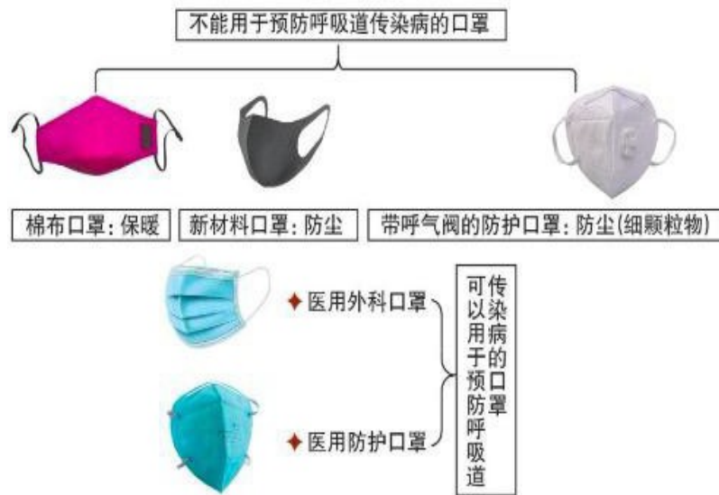
图 4 口罩类型